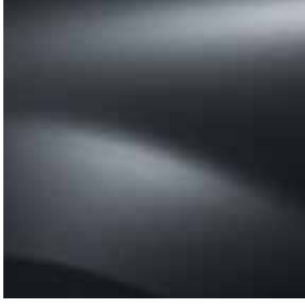
GRİ FÜME