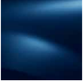
COSMO MAVİ (RPR)