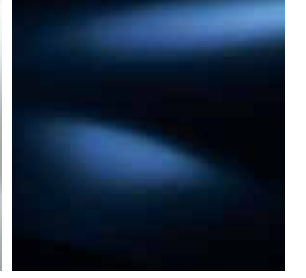
UZAY MAVİ (D42)**