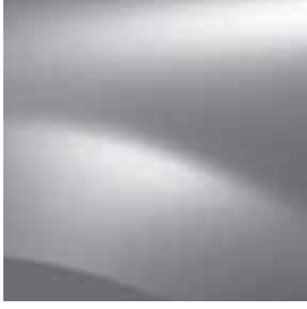
PLATİN GRİ (D69)