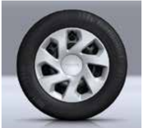
15" GROOMY JANT KAPAĞI**