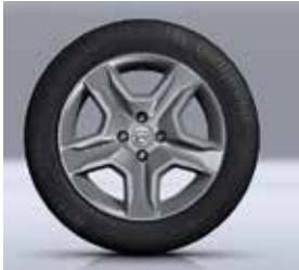
KOYU METAL 16" BAYADÈRE JANTLAR *

*Sadece Stepway versiyonda mevcuttur **Stepway versiyonda mevcut değildir.