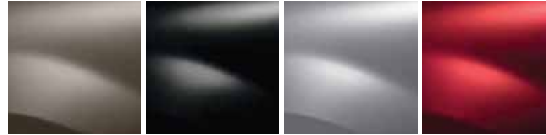
KÜL BEJİ (HNK)