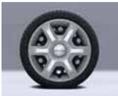
15" ARACAJI Standart