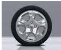
15" EMPREINTE Opsiyon (Stil paketi içinde)