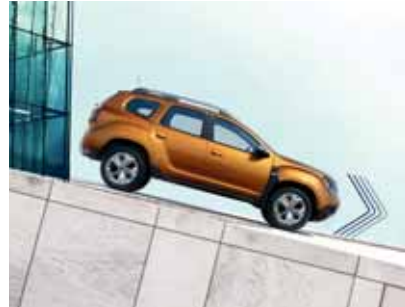
YOKUŞ İNİŞ DESTEK SİSTEMİ