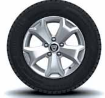
16" ALÜMİNYUM ALAŞIMLI JANT