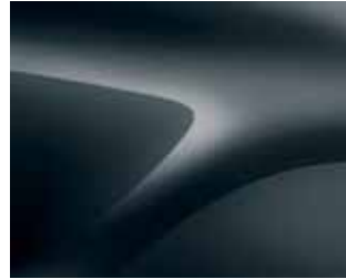
GRİ FÜME (M)