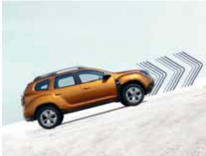
YOKUŞ KALKIŞ DESTEK SİSTEMİ

Sana sadece yolların ve arazilerin keyfini çıkarmak kalıyor.