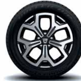
17" ALÜMİNYUM ALAŞIMLI JANT