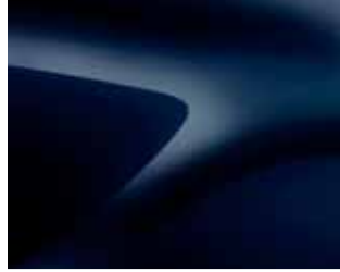
UZAY MAVİ (O)