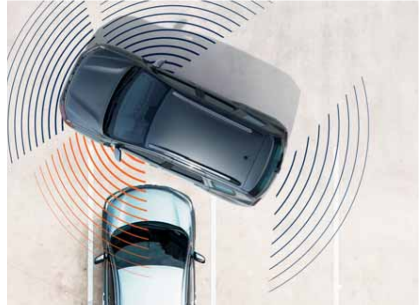
360 ° KAMERA