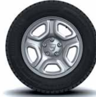
16" ÇELİK JANT