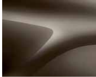
VİZON KAHVE (M)