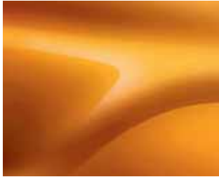
ATACAMA TURUNCU (M)