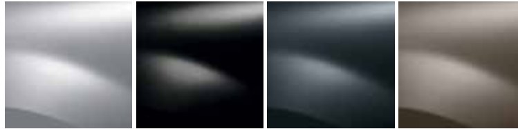
PLATİN GRİ (D69)