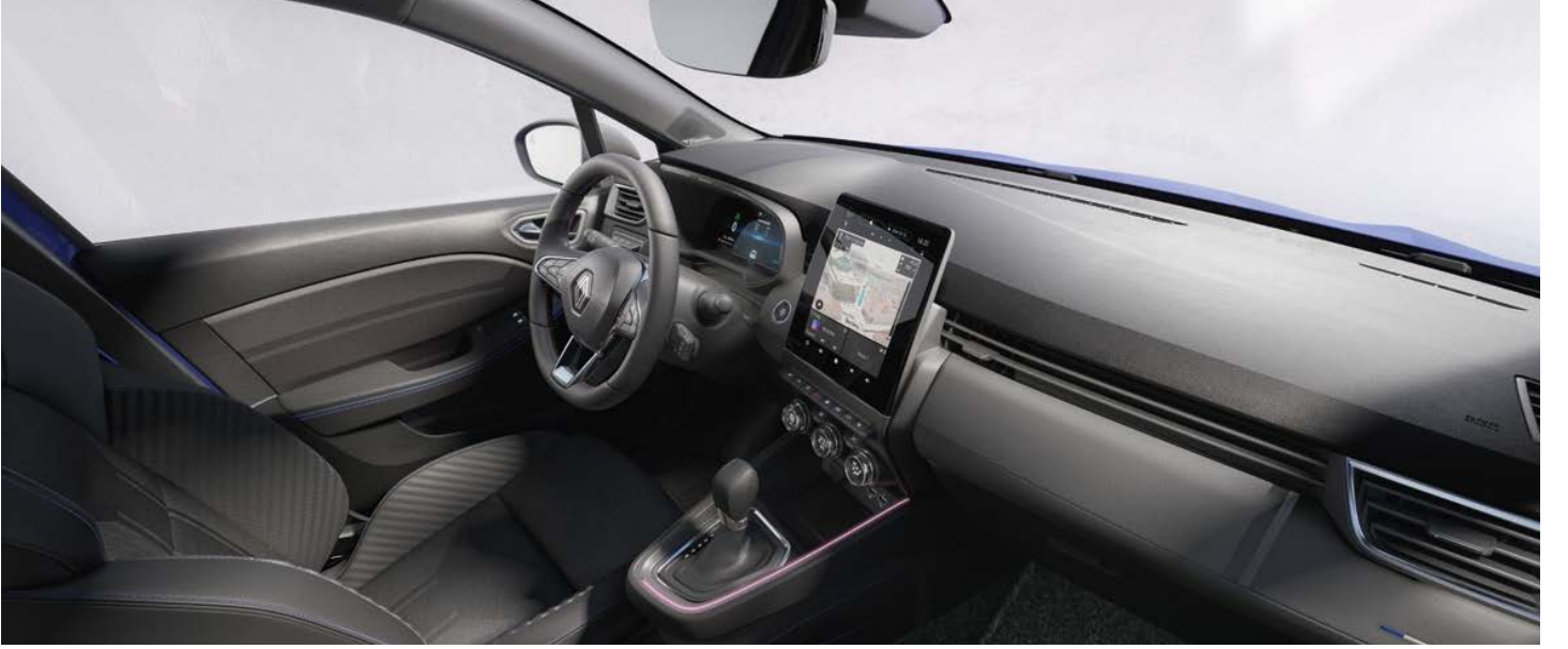
techno esprit Alpine